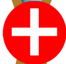
Applanation Tonometer HT5000