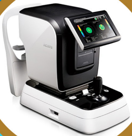
Auto Refracto Keratometer HRK8000A