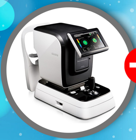
Auto Refractometer Keratometer HRK8000A