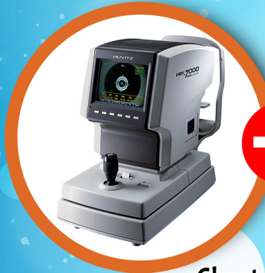
Auto Refractometer Keratometer HRK7000A